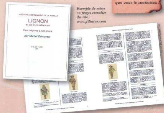
Exemple de mises en pages extraites du site : www.filiatus.com

Filiatus est aussi un logiciel complet de généalogie, capable d'importer des données, de les comparer, de les intégrer, de dresser des statistiques, d'incorporer des images, de générer des pages Internet. Il dispose de fonctions de recherche et de comparaison élaborées. Il existe depuis plusieurs années, sans cesse amélioré par son concepteur qui, après la version Classique , vient de sortir une version Familium , cette dernière ajoutant une fonction exclusive : éditer la généalogie des habitants d'un village entier, si l'on dispose bien sûr de la totalité des filiations d'une paroisse. C'est là un travail titanesque mené par les bénévoles des associations généalogiques dont certaines utilisent Filiatus pour écrire le grand livre du village. Un signe d'intérêt pour ce logiciel qui navigue souvent hors des sentiers battus et rebattus par ses concurrents.