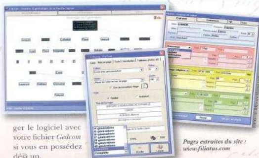
Pages extraites du site : www.filiatus.com

Filiatus est en vente uniquement en téléchargement sur www.filiatus.com . Version d'essai intégrale valable 30 jours, renouvelable une fois. Tarif réduit pour les responsables d'associations, gratuit pour les chômeurs.